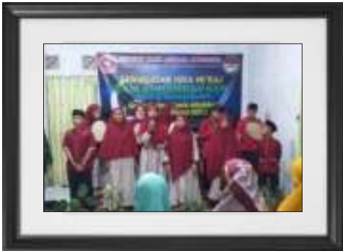
Grup Hadroh Anak - Anak Asuh Panti Asuhan Attafakur