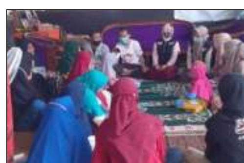
Kunjungan & Sosialisasi dari ACT Peduli Masyarakat