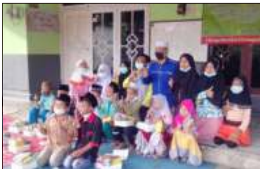
Kunjungan & BakSos dari PMR SMAN 1 Jember