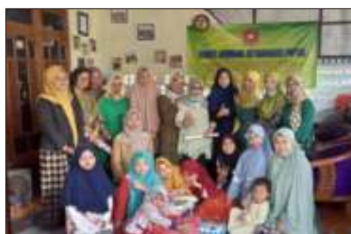
Kunjungan dari Alumni SMKK Angkatan 83 Jember