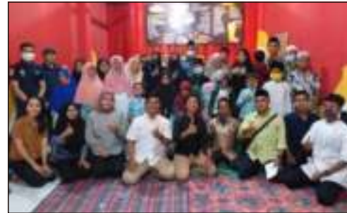
Undangan Tasyakuran Pembukaan Warung Mang Sabay