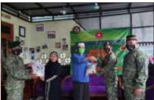
Kunjungan & BakSos dari Ta'mir Masjid Yonif Raider 509