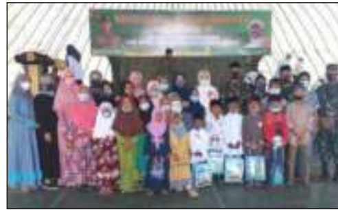
Undangan Peringatan Isra' Mi'raj Yonif Raider 509 Jember