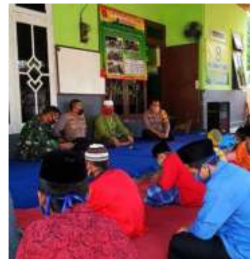
Kunjungan Kapolres & Dandim Jember

Pandemi Covid-19 yang baru saja mendarat di Indonesia. Sosial Distancing diberlakukan, mulai dari Sekolah, Pusat perbelanjaan, Area publik, Lembaga Pemerintahan bahkan sampai tempat ibadah. Al hasil, sepi, sunyi dan lenggang di tempat-tempat itu. Begitu pula kondisi di Panti Asuhan Attafakur, sepi karena kita berdo'a dan berbuka hanya dengan teman-teman sepanti saja. Panti Putra, Putri dan Pengurus di Sekretariat mengadakan kegiatannya ditempat masing-masing. Tidak seperti tahun sebelumnya, bulan puasa biasanya kami do'a bersama dengan kawan-kawan anak asuh non panti, buka puasa bersama sampai sholat mahgrib dan