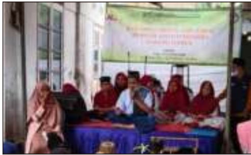
Undangan Lanching Kantor LAZ Persada Cab.Jember