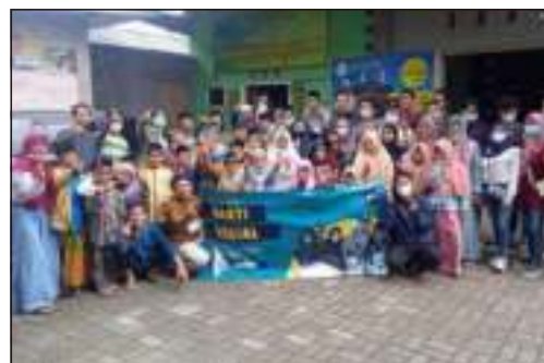
Kunjungan & BakSos dari Mahasiswa UNEJ Fak. Electro