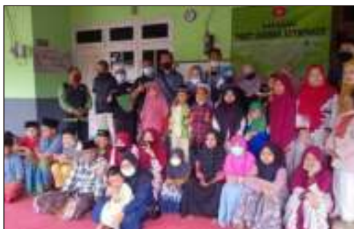
Kunjungan & BakSos dari CSR Bank Mandiri