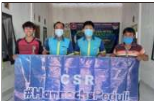
Kunjungan & Bantuan Lampu dari CSR PT.Hannochs