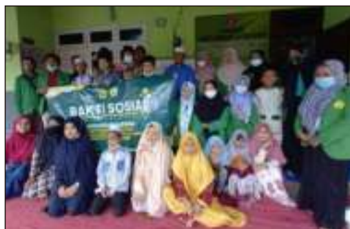
Kunjungan & BakSos dari Mahasiswa UIJ Fak.Tarbiyah