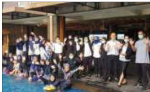
Undangan dari Management Hotel Aston