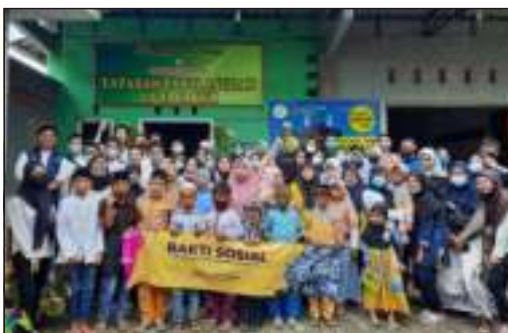
Kunjungan & BakSos dari Mahasiswa UNEJ Fak. Kimia